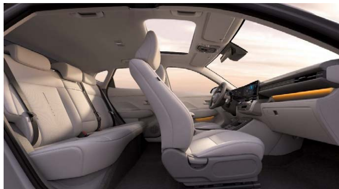
Vékony ülések és tágas belső tér