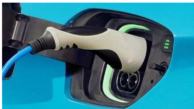
Fűthető elektromos töltőnyílás