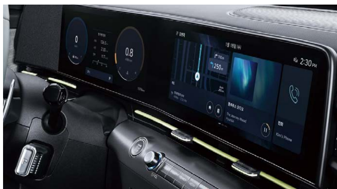
Dupla 12,3"-os kijelző